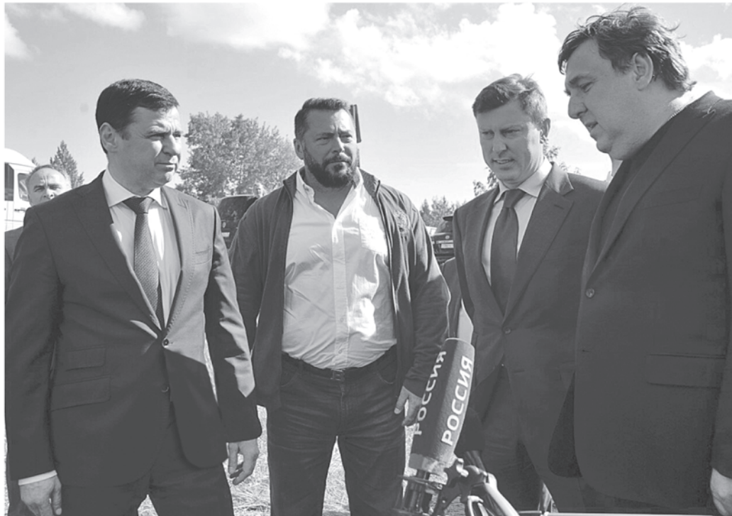
Рабочая поездка в Ростовский район

– Объём финансирования дорожных работ составит более 5 млрд рублей, что позволит нам